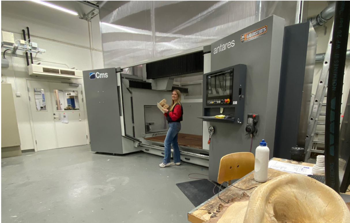
VERKSTÄDER SOM FORSKNINGINFRASTRUKTUR: Den stora CNC-fräsen utnyttjas för experimentalitet och forskning kring 3D-form.