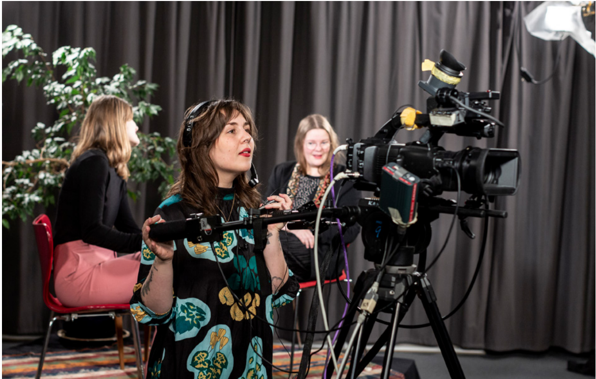
ÖKAD MEDIALITET: Vi utbildar framtidens medborgare och utvecklar kunskap i vad bild och form kan göra för människors lärande, utveckling och kommunikation. Bild från Konstfacks Ljud- och bildstudio. Foto Robert Blombäck.