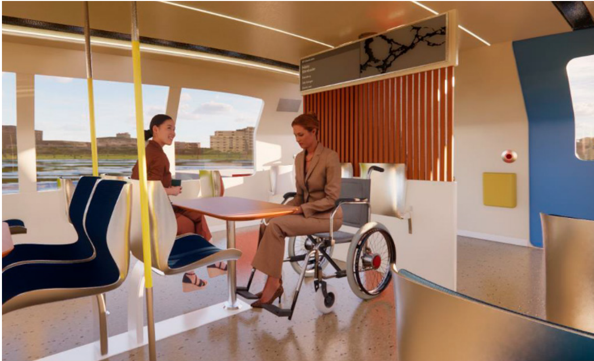
ÖKAD INNOVATION: Candela P3 interiör; samarbete Konstfack (industri-design, inredningsarkitektur) och företaget Candela Technology. Projektet fokuserade på hållbart pendlande i Stockholmsregionen med eldrivna bärplansbåtar (svåvare).