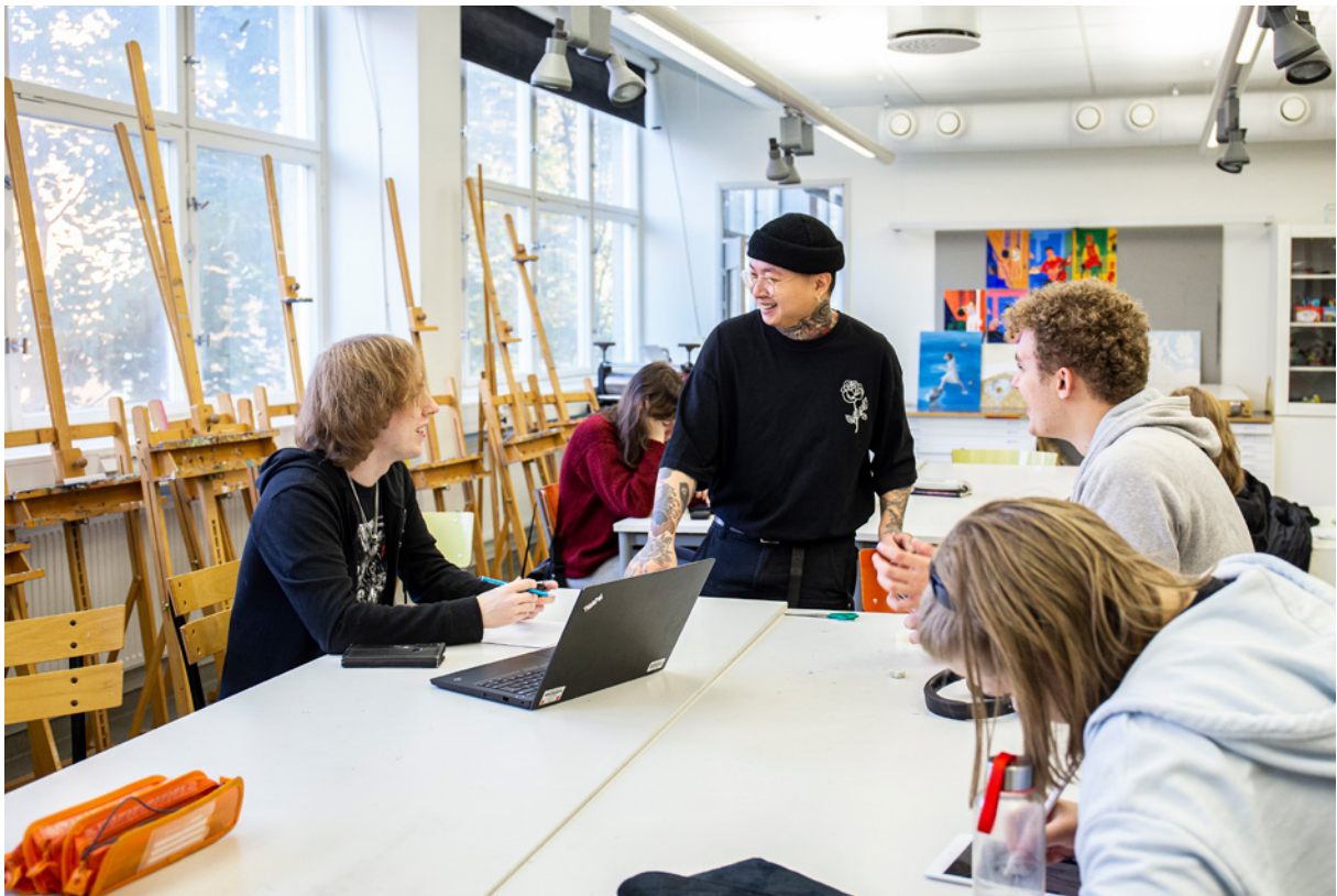
ÖKAD EXPERIMENTLUSTA, EMPATI OCH KREATIVITET: De estetiska ämnena är väsentliga förmågor inför framtiden, och en viktig del av grund- och gymnasieskolorna i Sverige.