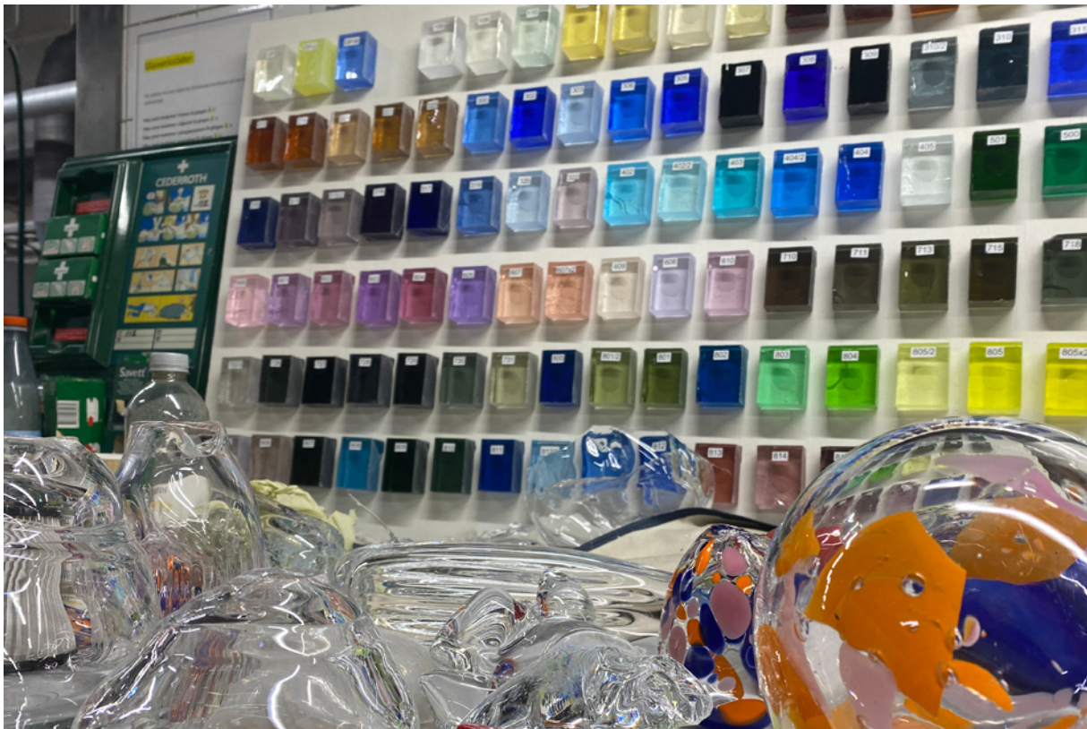
VERKSTÄDER SOM FORSKNINGINFRASTRUKTUR: Materialitet genom experimentalitet och forskning. Bild från glasstudion.