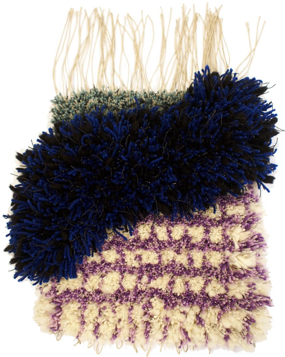
Tuftat prov, ull och lin, utsnitt 35x40 cm, Lisa Nilsson 2014