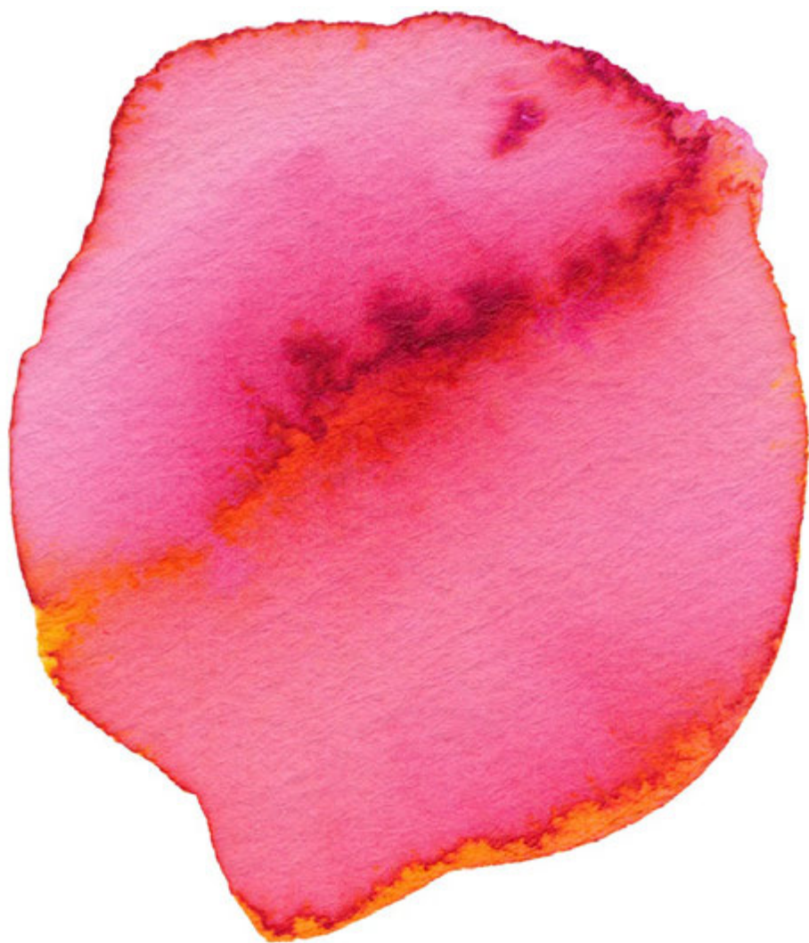
Skiss, tuftad matta, Anneli Tegelberg 2014