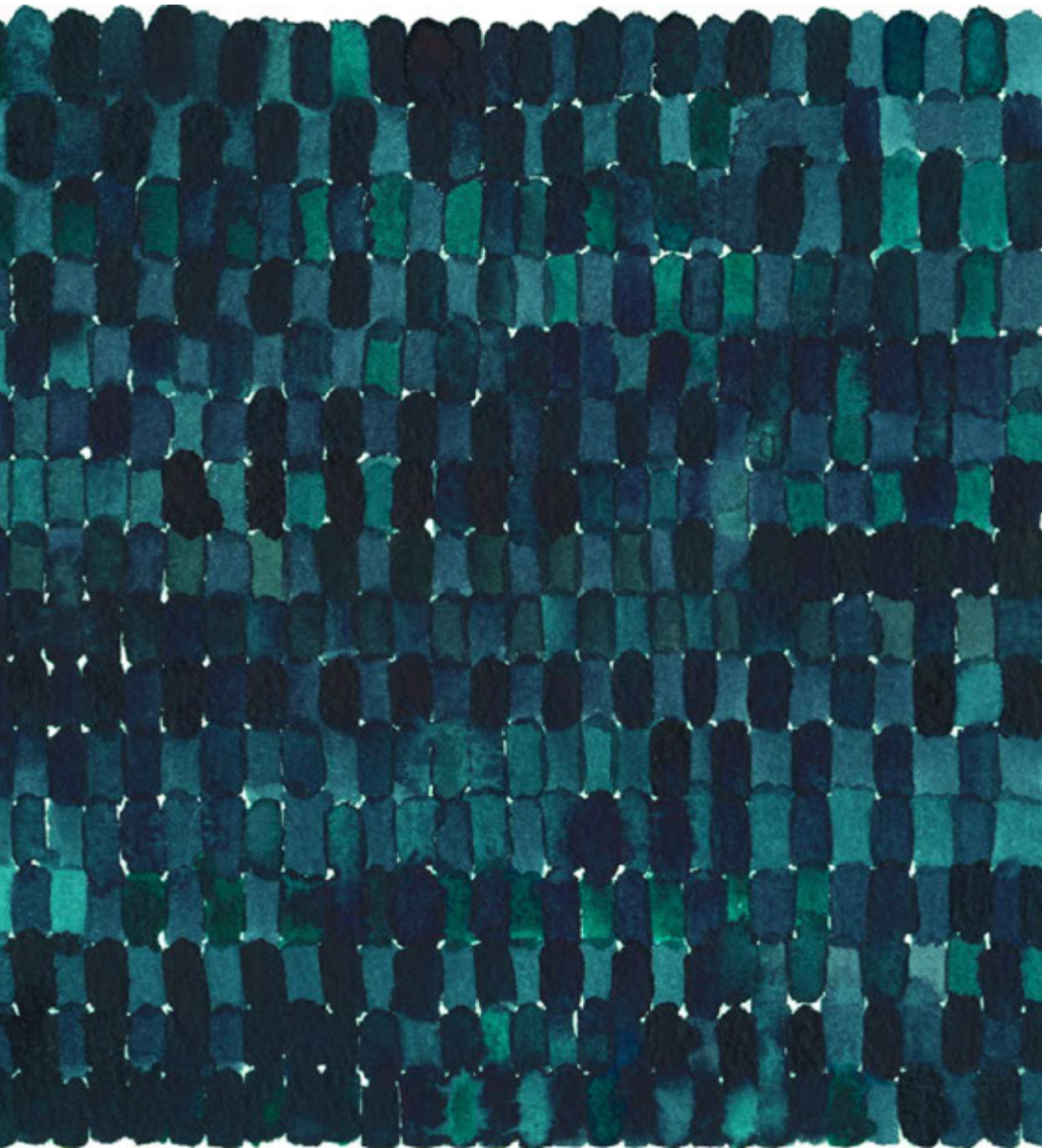
Skiss, tuftad matta, ull och lin, Emma Bengtsson 2014