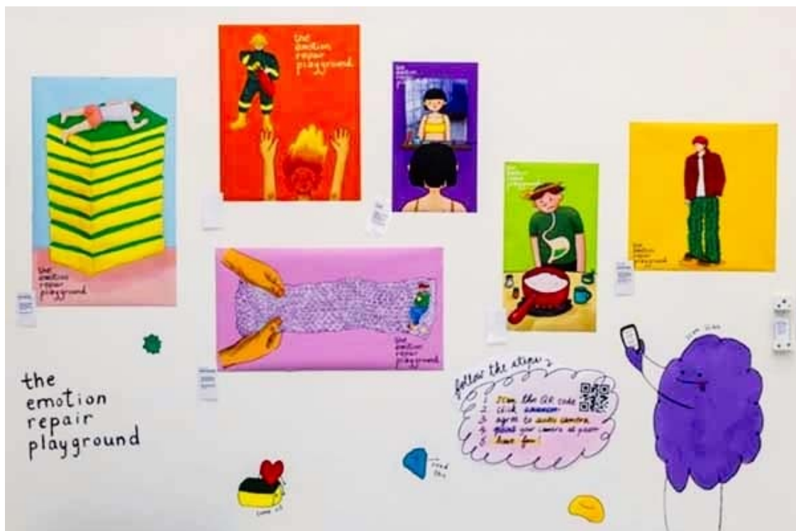
"Lekplatsen för reparation av känslor" av Weng Sut Vong.