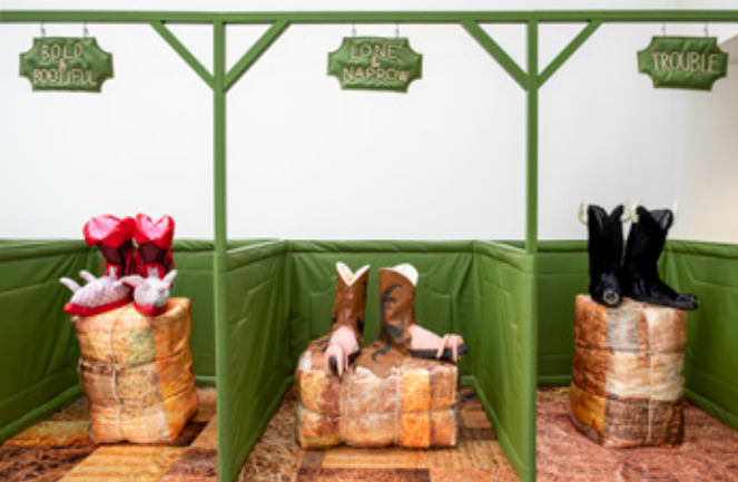
↓ Konrad Lidén, Still-Life Stock, 2021