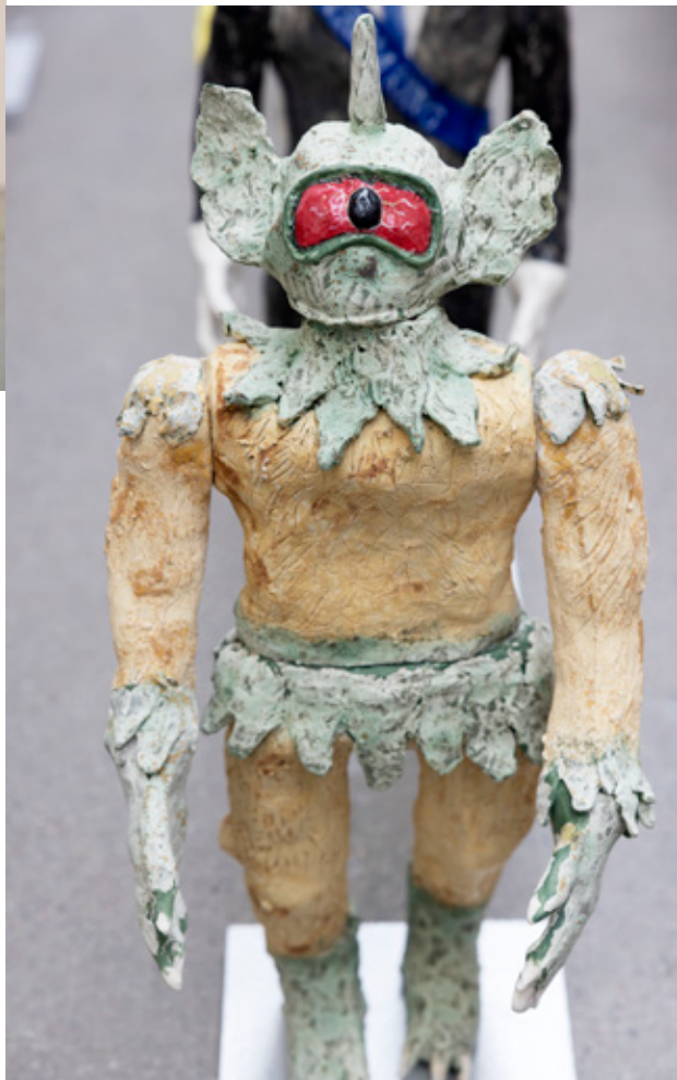
↓ Truls Mårtensson, How to disappear, 2022