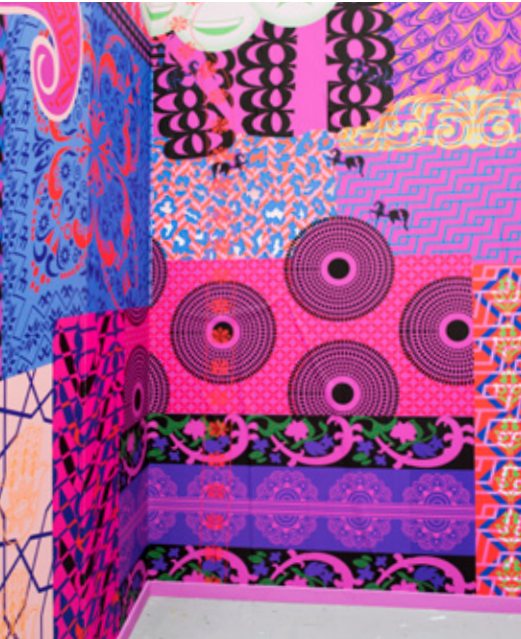
↓ Siri Lamminen Hagerfors, More is More, 2017