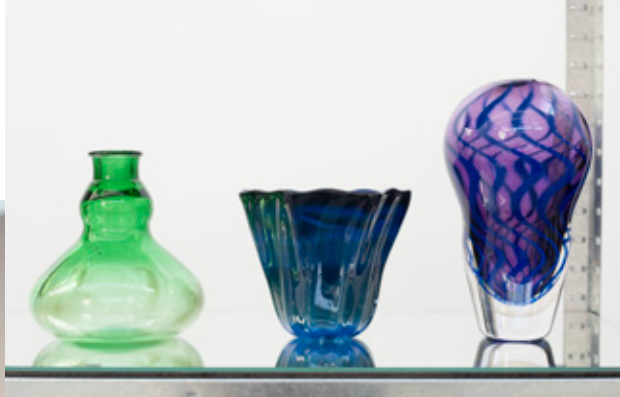
↑ Jonas Iannou, Tradition: en visklek, 2019