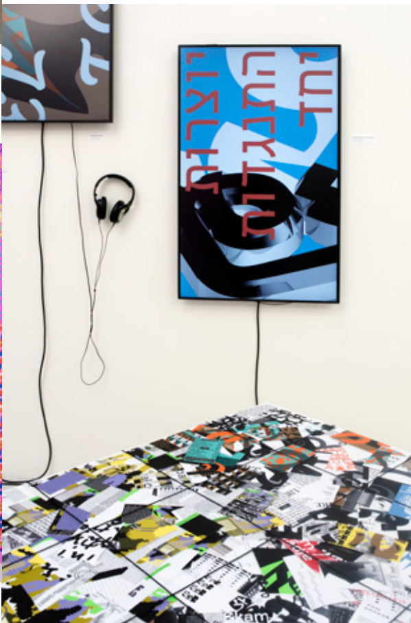
↓ Minda Jalling, Feeling-Doing-Feeling, 2018