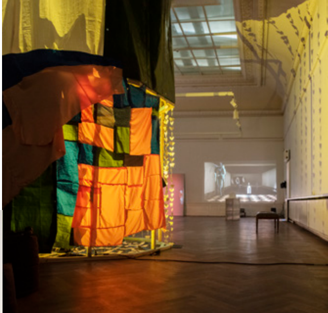
Isabella Kalén, Viloplats, 2021 →