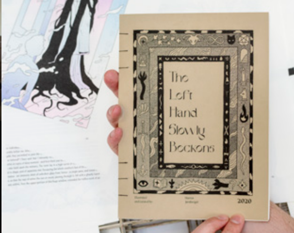
↑ Marcus Jernberger, The Left Hand Slowly Beckons, 2020