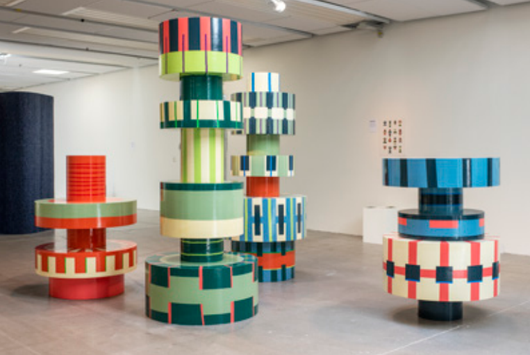
↓ Siri Svedborg, Pall, bord och stol, 2020