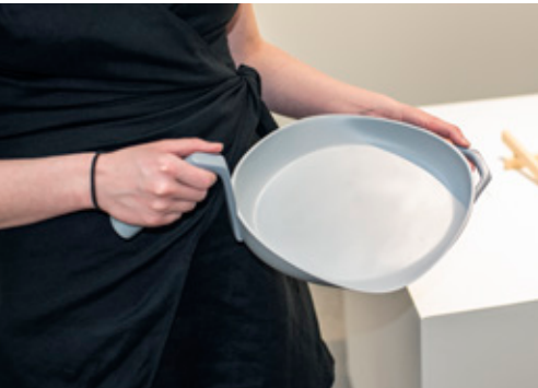
↑ Alice Eklöf, Frying Pan, 2019