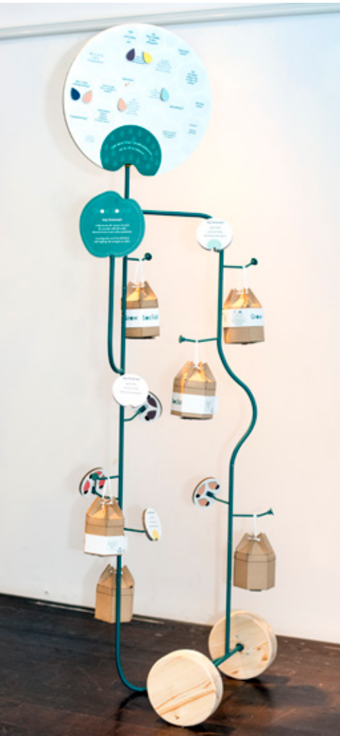
← Sofia Ljung, Grow Social, 2020